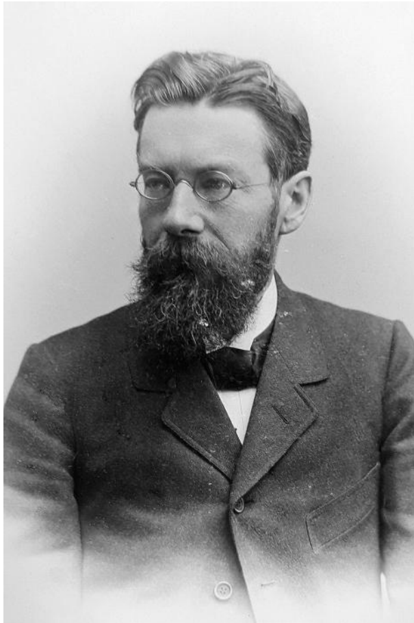
1 Wilhelm Erman (1850–1932). Das Foto wurde in Breslau, vermutlich zwischen 1901 und 1907 aufgenommen. Aus dem Nachlass Martin Bollert, ULB Bonn Foto: Knoche

publizierte er zwei Zeitungsartikel zum Thema. 3 Diese Stellungnahmen sandte er auch an den Reichsminister des Innern Hugo Preuss, der Mitbegründer der DDP war, und an weitere Adressaten, auch an den Beirat für das preußische Bibliothekswesen und den VDB. Der Beirat schloss sich in einer Stellungnahme der Initiative Ermans an und schlug zusätzlich vor, das »volkstümliche Bibliothekswesen« gleichermaßen der Reichsgesetzgebung zu unterstellen. 4 Im Frühjahr 1919 konnte sich Erman sehr zufrieden über den Stand der Dinge äußern: »Der Vorschlag, die Bibliotheken der Reichsgesetzgebung zu unterstellen, hat überraschend gute Aufnahme gefunden: der Abg. Koch, dessen Anträge über die Reichskompetenz in der 1. Lesung des Ausschusses fast unverändert angenommen worden sind und auch der Minister des Innern Dr. Preuss haben mir mitgeteilt, dass sie meinen Vorschlag in der 2. Lesung aufnehmen werden. [...] So könnte man auf einen Erfolg rechnen und auf die Nationalbibliothek hoffen, wenn nur die Nation bestehen bleibt, der sie dienen soll!« 5