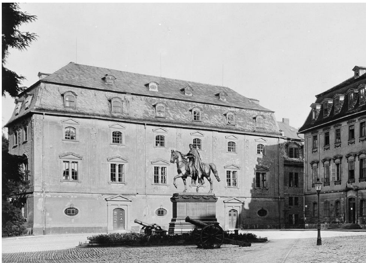
3 Die Thüringische Landesbibliothek Weimar (heutige Herzogin Anna Amalia Bibliothek), noch mit Kanonen vor dem Haus. Aufnahme aus dem Jahr 1919